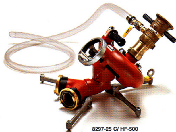
8297-25 C/ HF-500